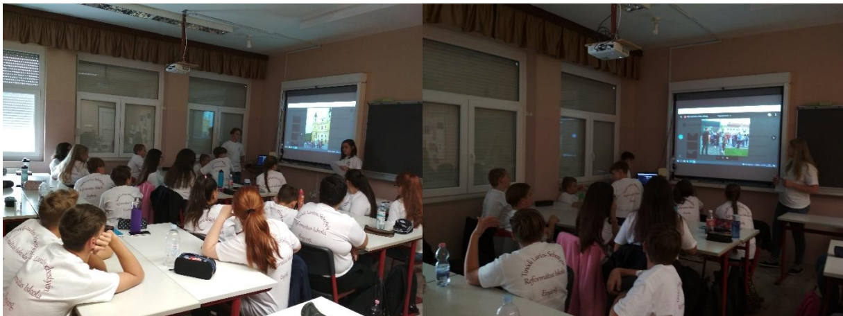
Készítette a 8. osztály

Garantáltan egy örökre szóló élmény marad. Többen tervezzük, hogyha a vírusveszély elmúlik vissza megyünk Erdélybe és megmutatjuk szüleinknek is ezt a gyönyörű vidéket, a kedves vendégszerető embereket.